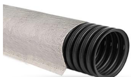
Однослойная с перфорацией в геотекстиле