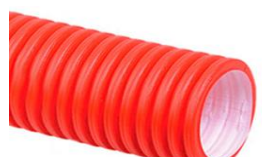
Двухслойные жёсткие электротехнические трубы SN8 в отрезках