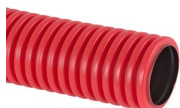
Двухслойные гибкие электротехнические трубы SN6 без протяжки в бухтах