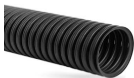
Однослойная с перфорацией без геотекстиля