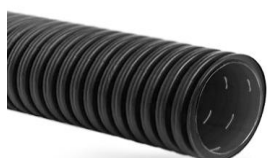
Двухслойные гибкие ПНД SN6 с геотекстилем