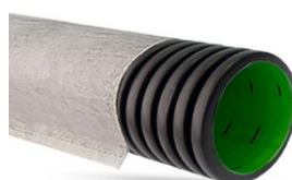
Жёсткая двухслойная труба «Ростпайп» SN10 с перфорацией с геотекстилем